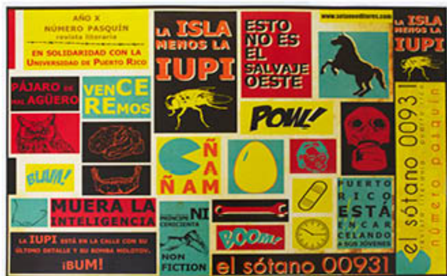
EL SÓTANO 00931 (Puerto Rico) La isla menos la IUPI, 2011 Digital print, 11" x 17 ¼" ea. (9 pages)